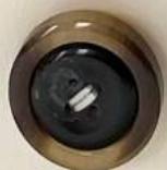
異材料 組み合わせ