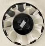
注型+カット (反射効果)