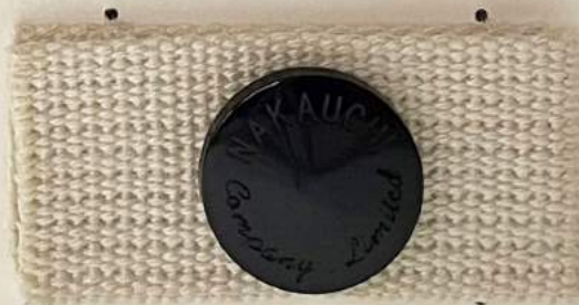
FMU-2215 25mm レーザー彫り 染色見本

↑スナップボタンに挟み込んでいるシートは台紙 縫付け用部品で、製品仕様ではございません。 仕様サンプルは下記をご参照ください。