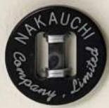
NCパラシュート穴 + NC消し彫り