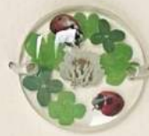
インクジェット + 注型