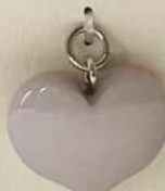
立体型パーツ + 染色