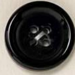
サイド模様 + 色入れ